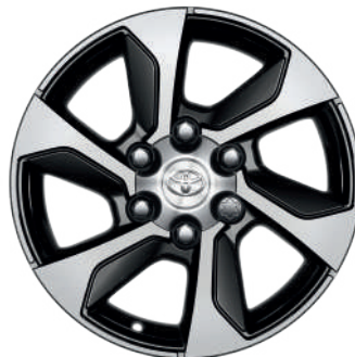
Колісні диски R18