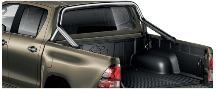
Дуга вантажної платформи