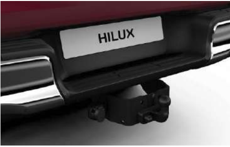
Зчіпний пристрій (фаркоп)