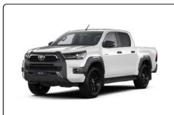
040 Білий, лак