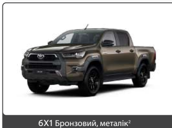
6X1 Бронзовий, металік 2