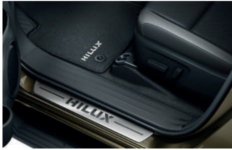
Накладки дверних порогів, килимки гумові