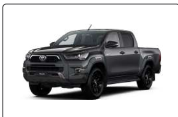
1G3 Сірий, металік