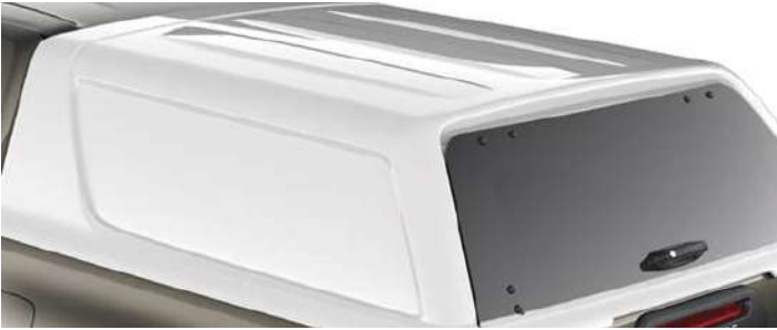
Жорсткий дах (кунг)