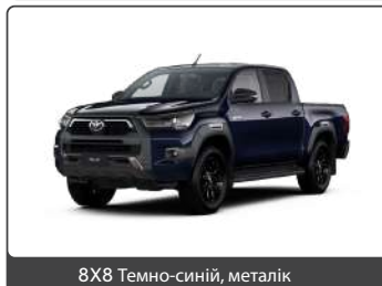
8X8 Темно-синій, металік