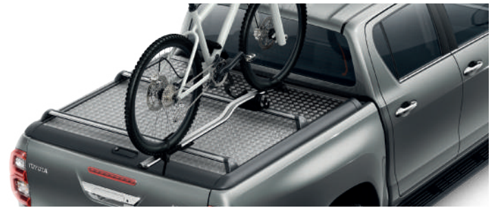
Кріплення для перевезення велосипеда на даху