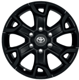
Колісні диски R17