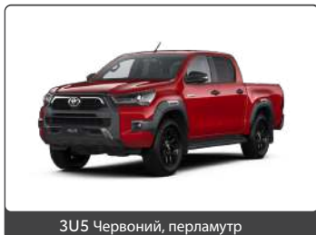
3U5 Червоний, перламутр