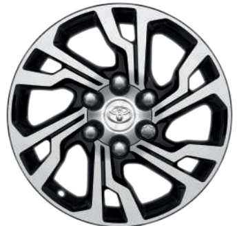
Колісні диски R18