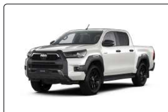
089 Білий, перламутр 1