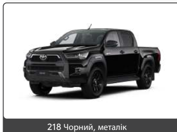
218 Чорний, металік