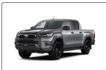
1L0 Сріблястий, металік