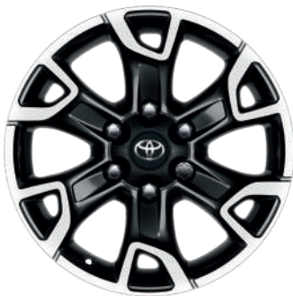
Колісні диски R17